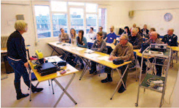
Information från Viveka Lyberg Åblander