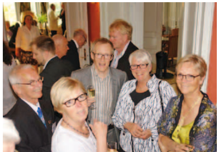
Glada miner inför kvällens middag