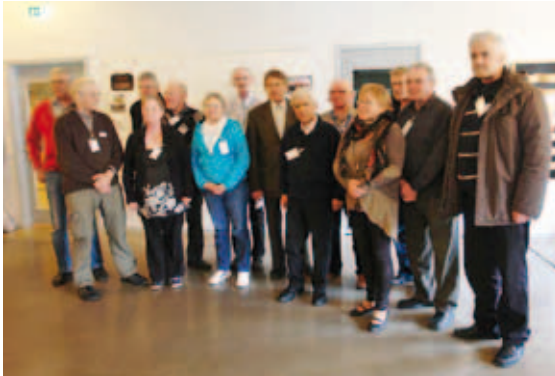
Här var de laryngektomerade