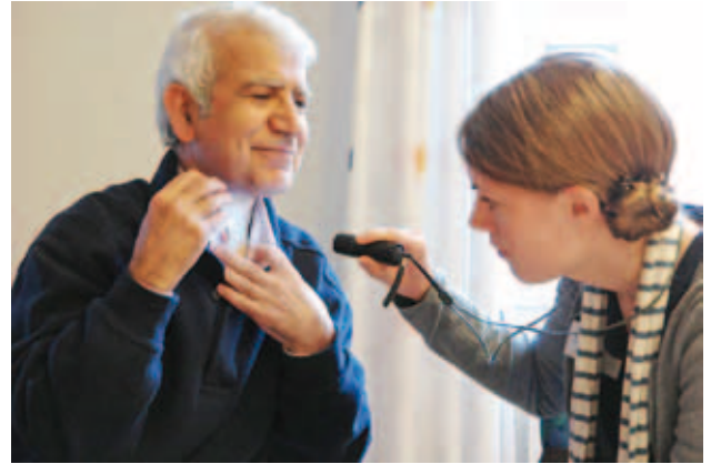
Logopedstudent tittar i ett stoma