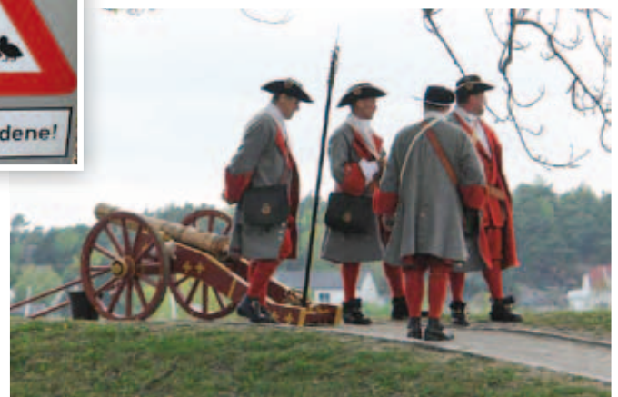
Kvällen till ära skulle det skjutas salut