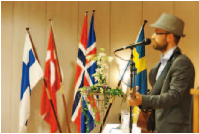
Lite sång och musik