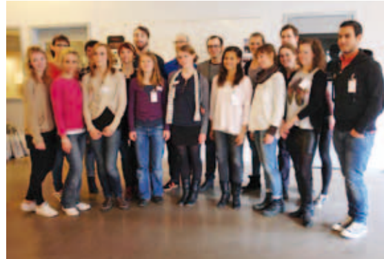
Här är studenterna

burken med ammoniakdoft spreds ut i salen florerade istället skämten om hur skönt det kan vara att ibland undvika att lukta!