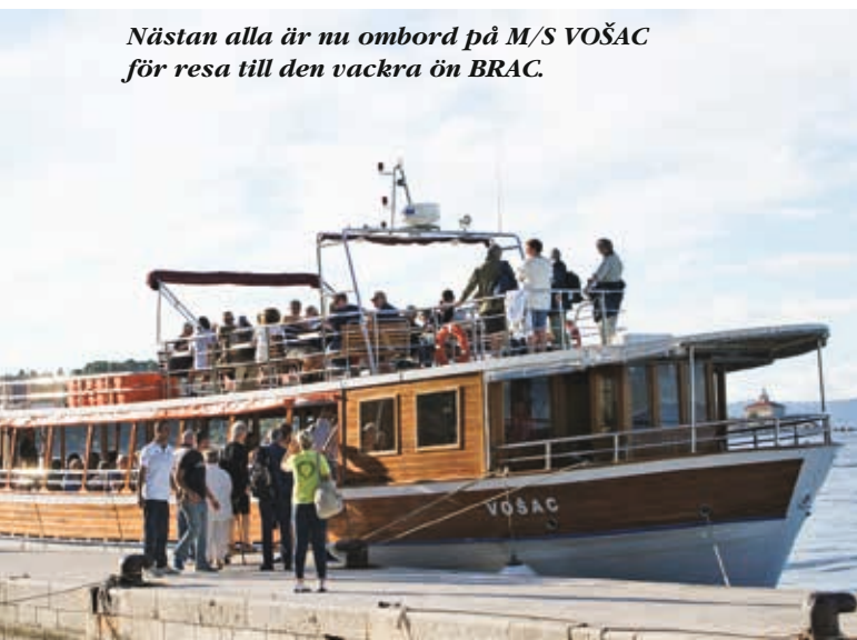
Nästan alla är nu ombord på M/S VOŠAC för resa till den vackra ön BRAC.