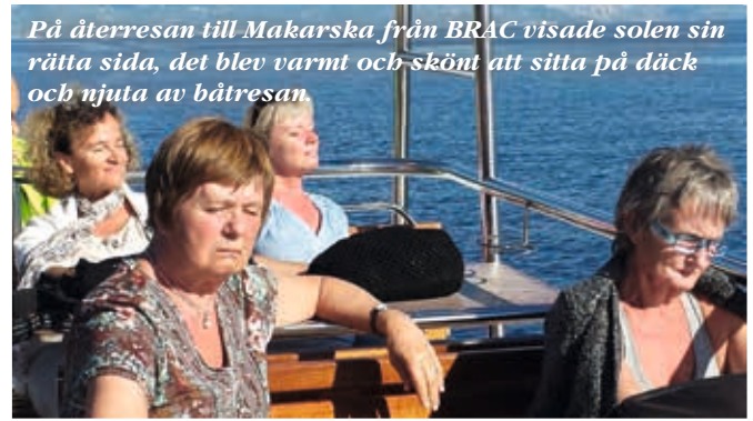
På återresan till Makarska från BRAC visade solen sin rätta sida, det blev varmt och skönt att sitta på däck och njuta av båtresan.

Text: Veera Baikova, Mun- och halscancerföreningen, Gävleborg