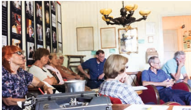
Vi lyssnade och tog till oss av Stig Dagermans liv och leverne.