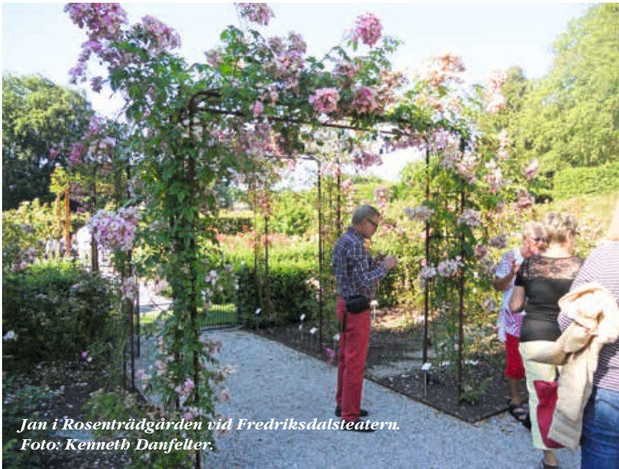
Jan i Rosenträdgården vid Fredriksdalsteatern.

kan mötet ha ett särskilt tema, kanske med en inbjuden expert, men tyngdpunkten då medlemmarna träffas är ändå den sociala samvaron och möjligheten att få information i olika frågor. Viktiga inslag i Laryngföreningens verksamhet är de årligen återkommande aktiviteterna, besök på Fredriksdalsteatern i Helsingborg och rehabiliteringsdagarna på Hillesgården i Skåne.