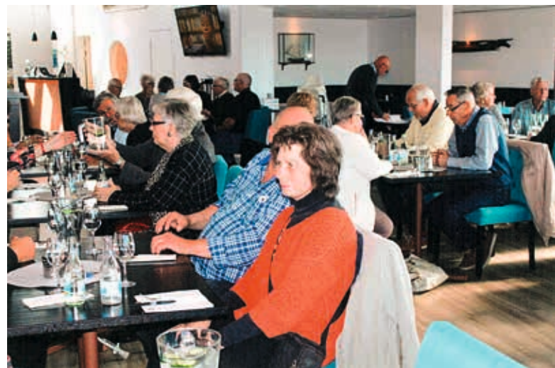
I väntan på lunchen.