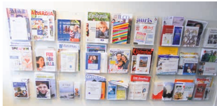
Föreningstidningar i Husknuten.