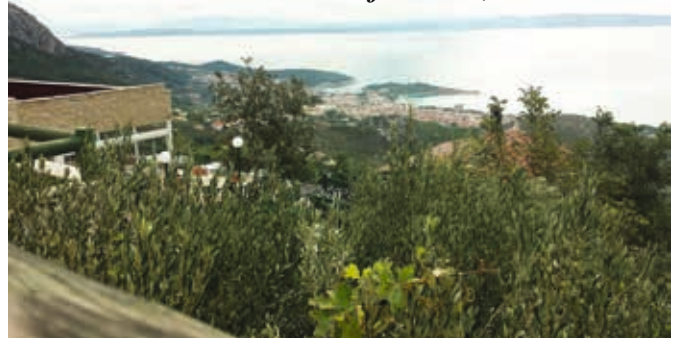
Staden Makarska lite från ovan, 440 meter ö.b.