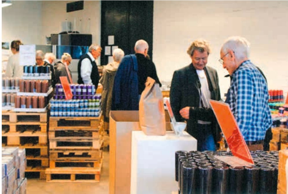
Besök i Liljeholmens ljusfabrik.

ETT MEDLEMSMÖTE innehåller naturligtvis information i olika aktuella frågor men lika viktig är den sociala samvaron och den känsla av samhörighet som växer fram ur de gemensamma upplevelserna i samband med sjukdom och behandling. Det är därför våra medlemsmöten har flera inslag av just gemensamma upplevelser och aktiviteter. Den här gången besökte vi Liljeholmens ljusfabrik som fanns inom gångavstånd. Här kunde vi