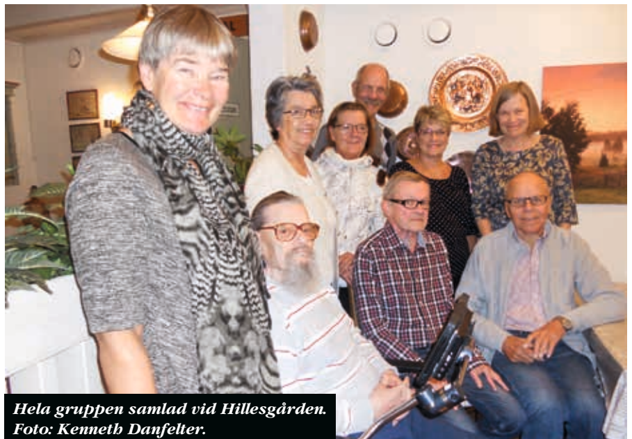
Hela gruppen samlad vid Hillesgården.

DE FLESTA AV Laryngföreningens möten, både med styrelsen och medlemmöten, brukar hållas på Husknuten. Några gånger om året brukar man också ha medlemmöten i Varberg och Falkenberg. Ibland