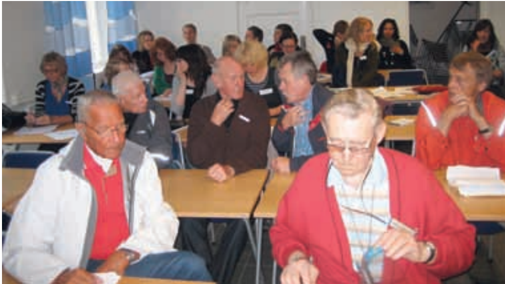
Kursdeltagare tillsammans med studenter

UNDER SJÄTTE TERMINEN på logoped-utbildningen i Lund är larydagarna ett återkommande och mycket uppskattat moment. För oss studenter innebär dagarna en chans att möta en del av verkligheten bakom konceptet laryng-ektomi och vad det kan innebära