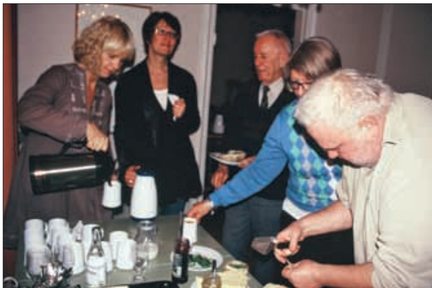
Kaffe utan smörgåstårta – men den kommer.

Gå in och titta på vår hemsida www.mhcforbundet.se