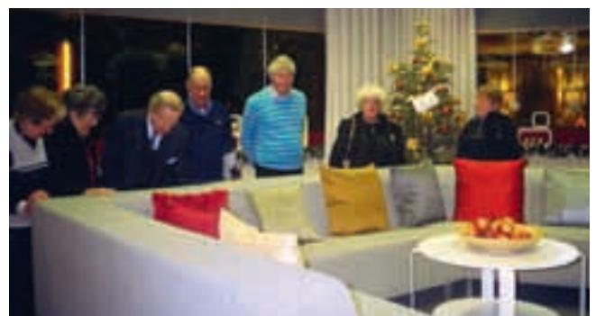
Den berömda intervju soffan

Fotograf: LENA LILLEHAMMER med en bederlig gammal kamera