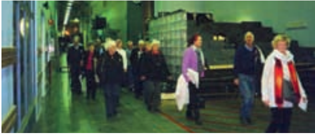
Korridorerna var både många och långa

vid TV-sändningarna. Det finns 29 olika sändningsstationer. Det kan vara upp till 30 personer vid en enda sändning. Hon berättade att allt skall gå så fort idag. Programmet Rederiet kunde tidigare ta tio dagar för ett avsnitt. Idag tar det inte lika lång tid.