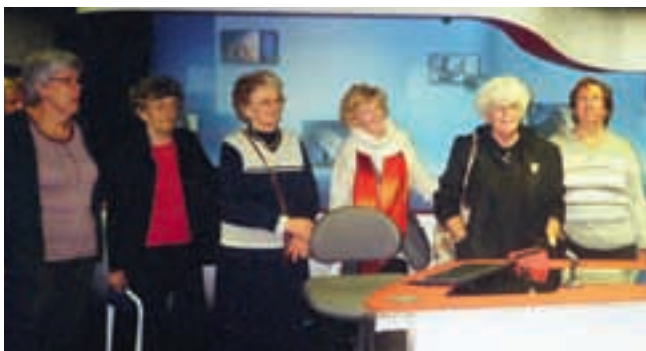
Ytterligare en studio

VI FICK GÅ TILL nyhetsredaktionen och titta på bord, TV monitorer och väderkartor. Nyhetsuppläsaren har ett eget manus som de läser ifrån på en liten TV skärm. Det