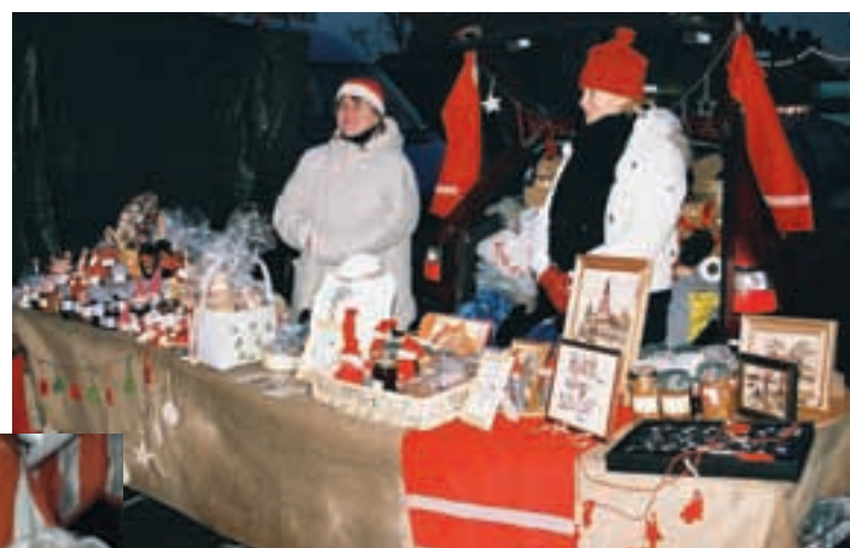
Marknadsstånd fanns det över allt, här ett med bemslojd