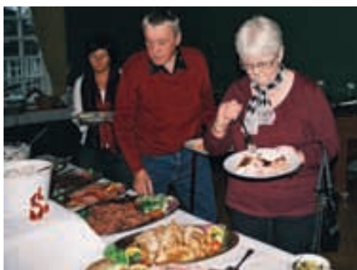
Vad skall man välja