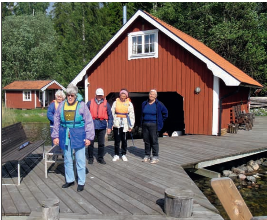
Några av deltagarna som tagit på sig flytvästar för att åka på båtutflykt