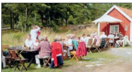
Buffé i det fria på restaurang Sjökantén