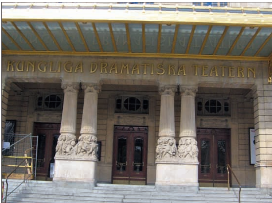
Entrén till Dramaten

nens uppdrag att ta fram och spela nyskriven svensk och europeisk dramatik. Scenen delas ibland upp i två mindre scener.