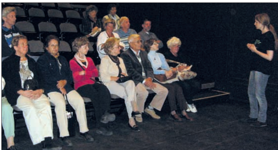
Guiden berättar om många av de olika kändisar som uppträtt på Dramaten

Elverket är Dramatens scen på Linnégatan 69. Sedan våren 2003 är sce-