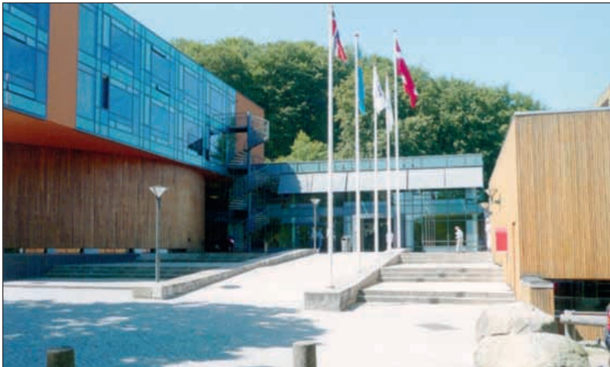
Vingstedcentret utanför Vejle

Dansk landsforening for laryngectomerede (DLFL) höll sin landskurs, inklusive årsmöte, 22-26 juni på Vingstedcentret utanför Vejle på Jylland.