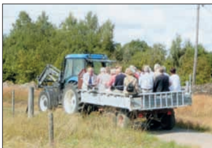
Rundtur på traktorsläp