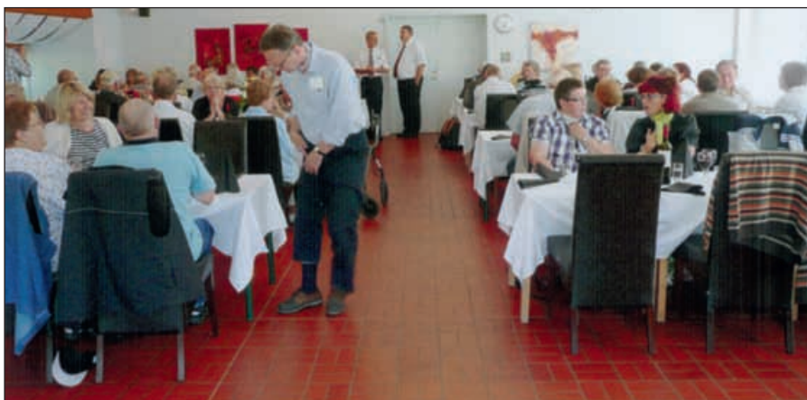
Grillfesten på den danska midsommaraftonen