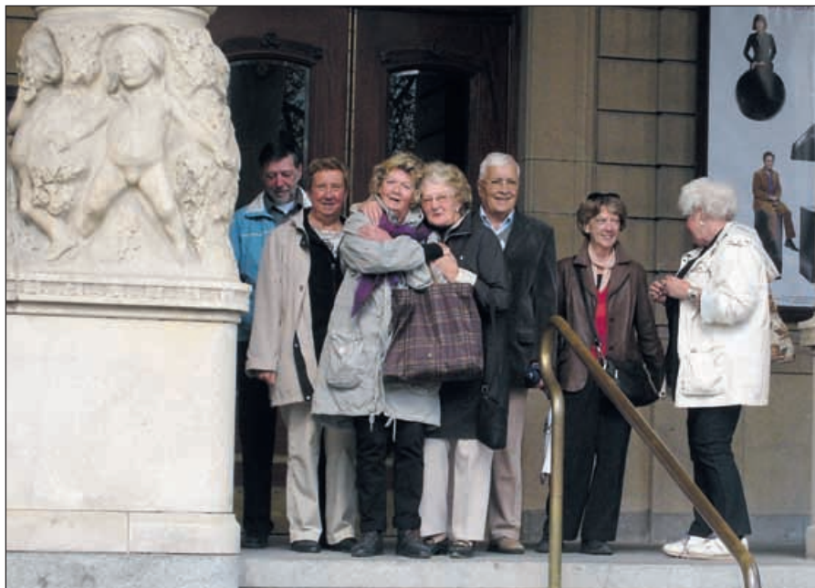
Den berömda trappan

Vår visning började med Stora scenen, där vi fick sätta oss på parkett för att få information av en mycket duktig och trevlig guide. Salongen