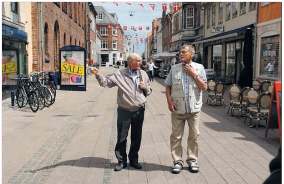
Två gubbar i stan

Vidare till Flyinge stuteri mycket känt för alla sina hästar detta ägs idag av staten. Och längst upp på en av skorstenarna lyckades vi få se en stolt stork stå och vakta sitt bo häftigt!