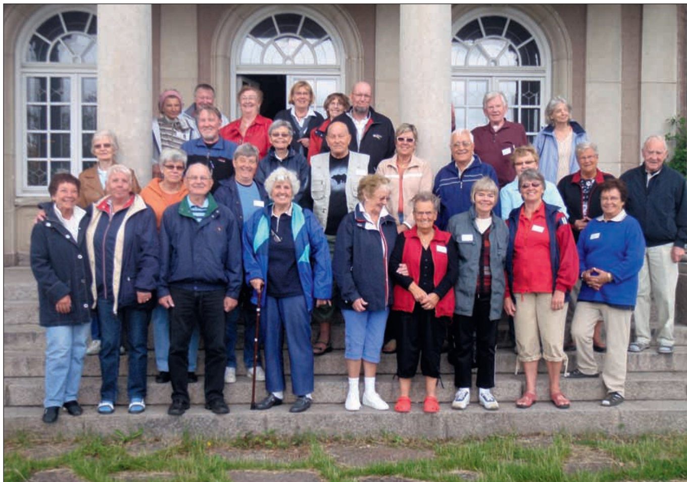
Deltagarna på Stensund

Nu har det äntligen blivit juni. De fem första dagarna i denna månad hade jag och 28 förbundsmedlemmar intagit Stensunds Folkhögskola.