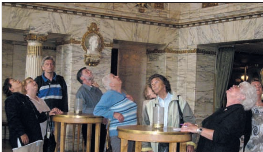
Vad är det för spännande där uppe