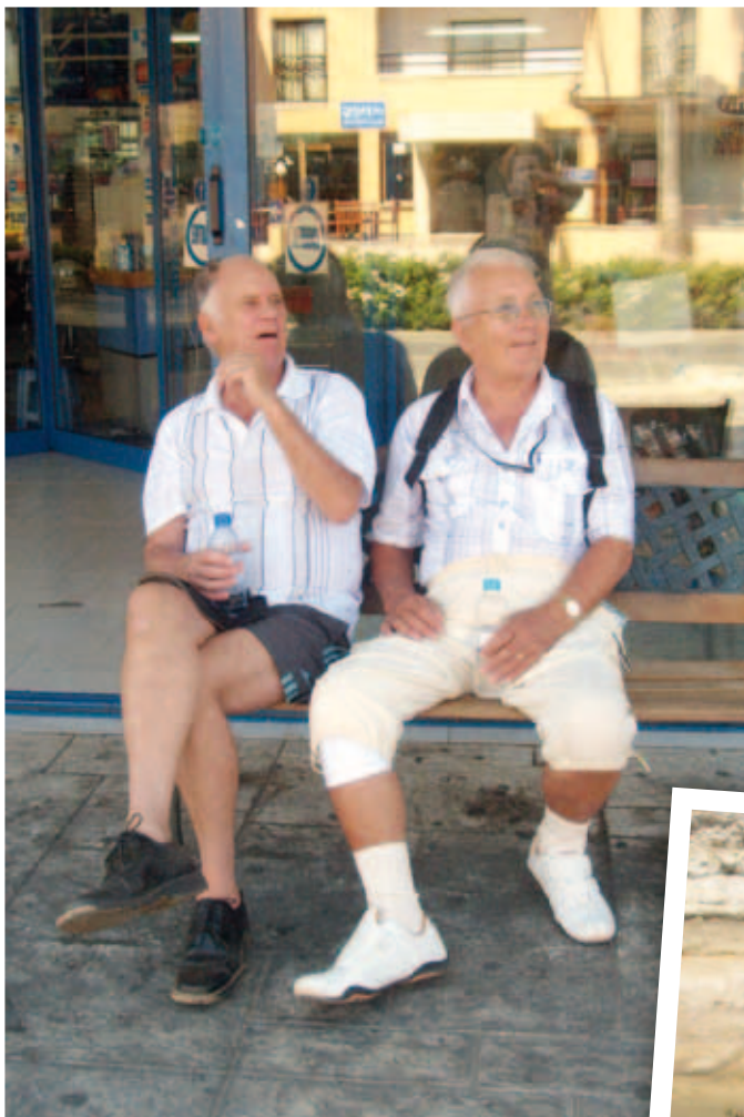
Harú sett vilka brudar