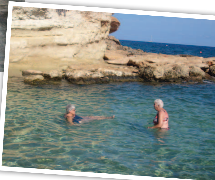
Den berömda blå lagunen