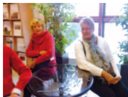
Kanske kommer dom nu