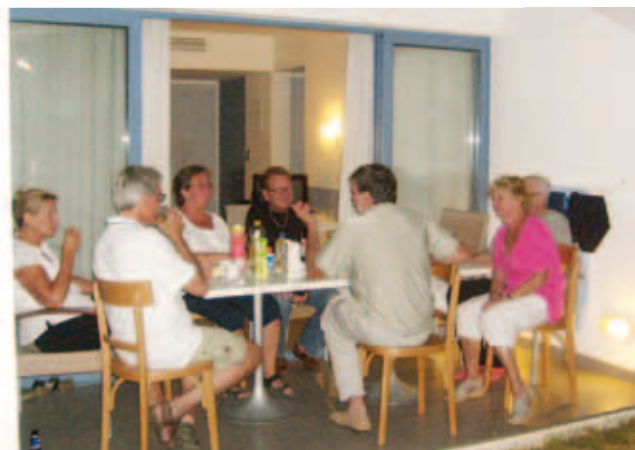
Några ur gruppen som fikar