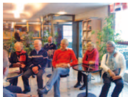
I väntan på visningen

EFTER ALL DEN BREDA informationen vi fått kände vi oss mogna för att tacka för oss och åka hemåt igen i det dålig "vädret".