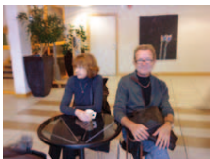
Kommer dom inte snart