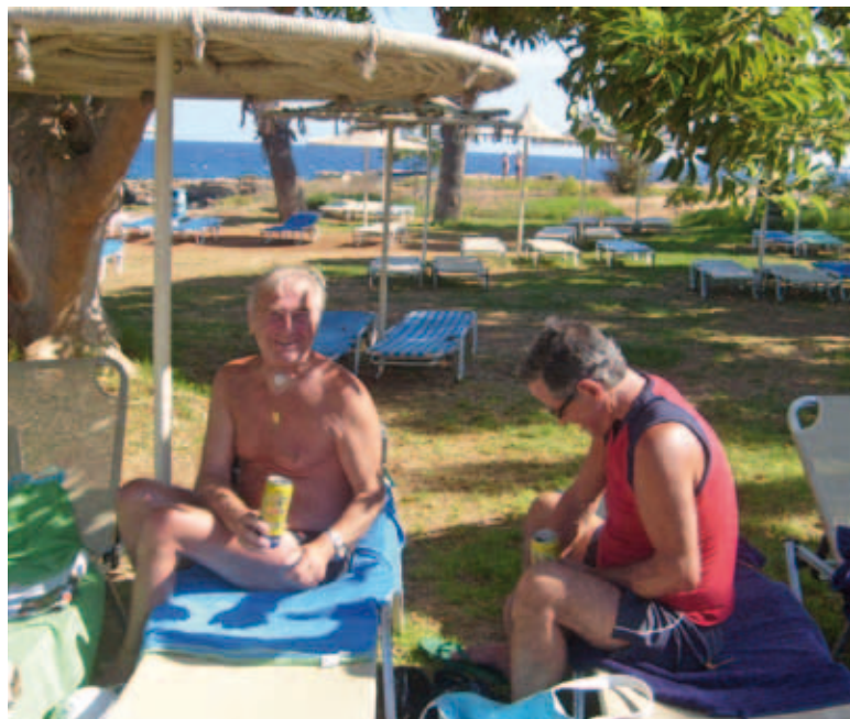
Vad säger du, ska vi ta ett dopp efter biran