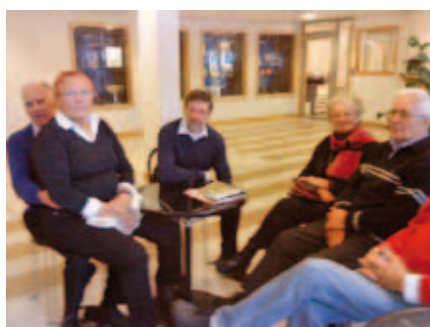
Sätt dig i mitt knä så länge