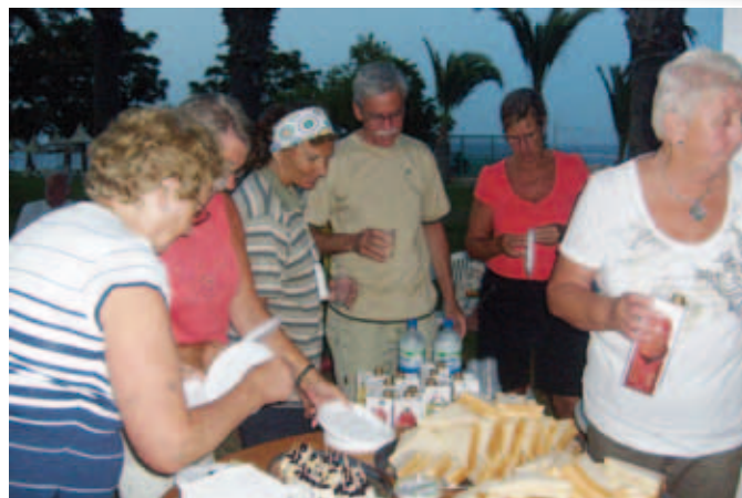
Medlemsmöte med buggsexa, ser ut som på Finlandbåten ungefär