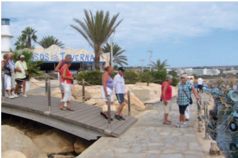
Nu är det stranden som gäller

Vi gjorde även en utflykt till Nicosia som blev delat 1974. Vi besökte