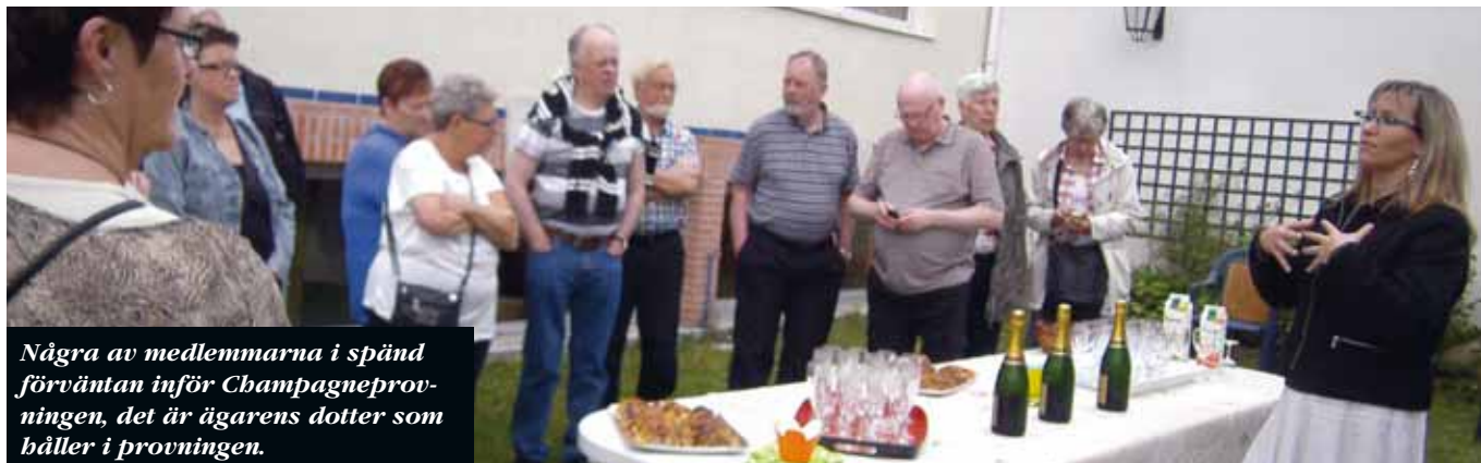
Några av medlemmarna i spänd förväntan inför Champagneprovningen, det är ägarens dotter som håller i provningen.

tigt, att på nära håll få studera dessa välkända turistmål är en fantastisk upplevelse, väl medvetna att vi skulle behöva många fler dagar här, för att hinna med allting, är vi ändå mycket nöjda med det vi hunnit med på så pass kort tid.