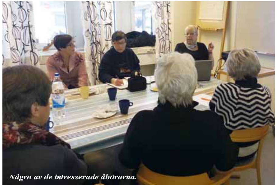
Några av de intresserade åhörarna.