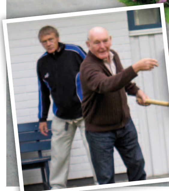
På kvällarna spelade vi kubb