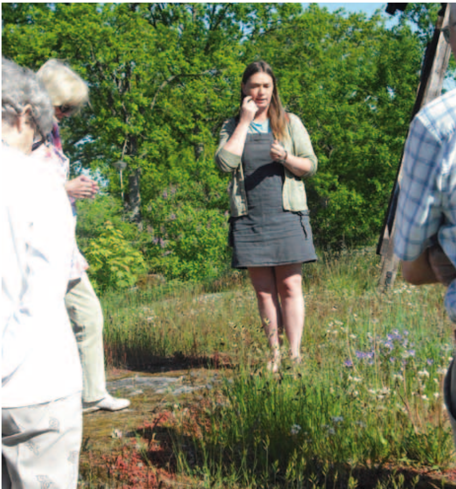
"Vavva" med åhörare

LÖRDAG , sista dagen, god frukost som vanligt (tack Hasse du gjorde ett kanon jobb).