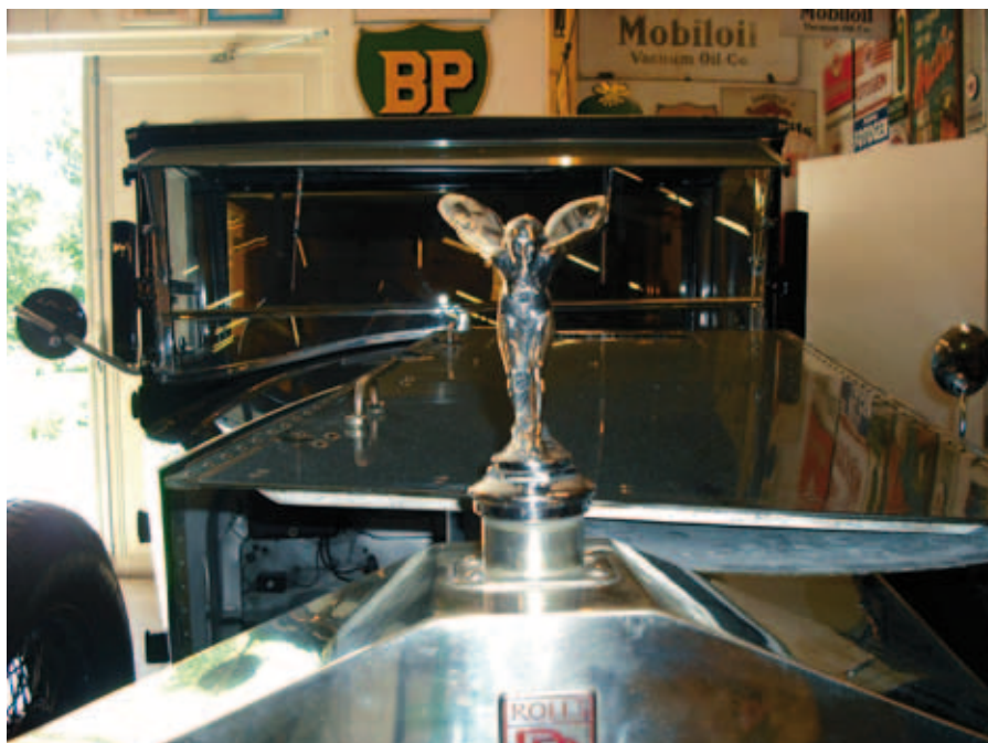
Slottet med ett museum