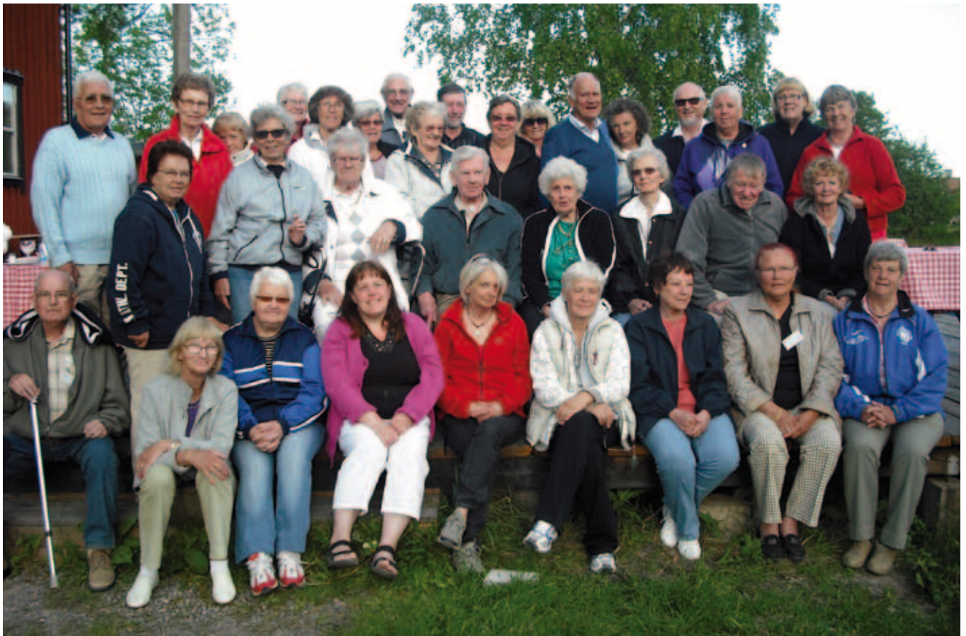
Hela gruppen samlad