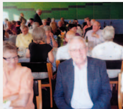
Artikelförfattaren trivdes i det danska sällskapet