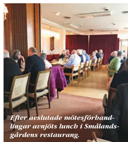
Efter avslutade mötesförhandlingar avnjöts lunch i Smålandsgårdens restaurang.