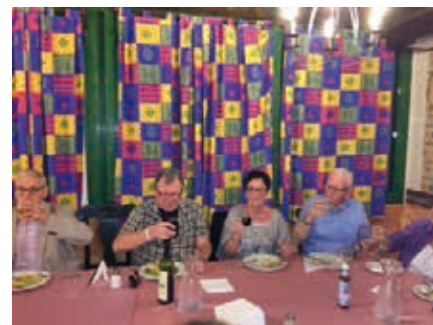
Middag på hotellet.

DÅ ALL FÖRTÄRING INGICK i resan, träffades vi vid måltiderna och umgicks även på kvällarna då hotellet bjöd på underhållning varje kväll.