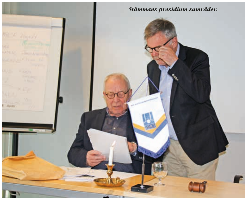
Stämmans presidium samråder.

VERKSAMHETS- OCH EKONOMI-BERÄTTELSENA behandlades utan särskild diskussion. En fråga som väcktes vid föregående års riksstämman var att byta förbundets namn till Huvud- halscancerföreningen. Då beslutades att förslaget skulle sändas på remiss till föreningarna och av de remissvar som inkommit framgick att något byte av namn i dagsläget inte önskades. Detta blev också stämmans beslut. När vi kom till valen var det dags att välja ord-