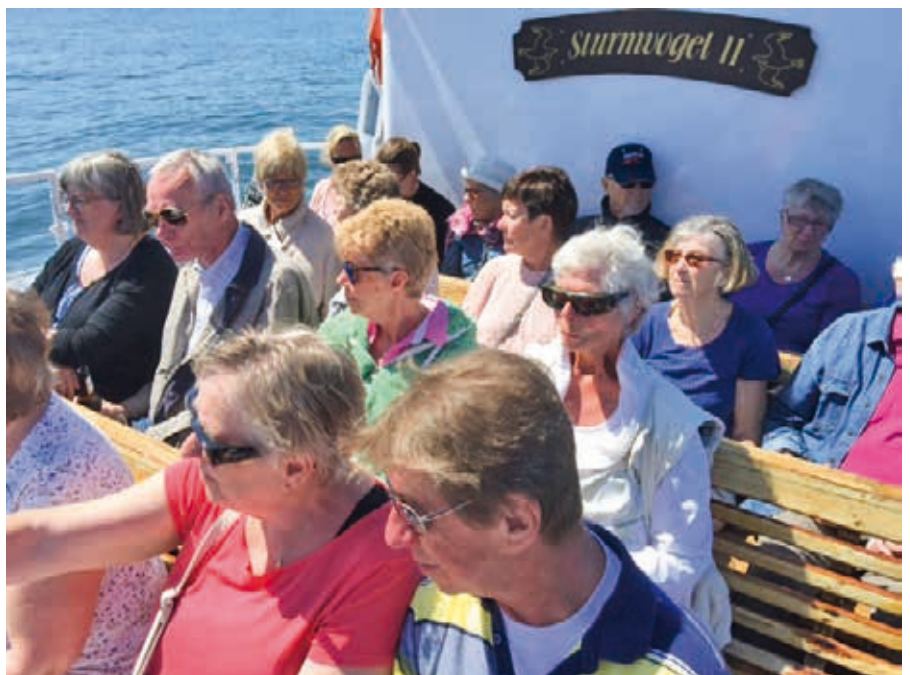
Efter lunch bjöds på en liten guidad båttur utes efter stranden. Solen lyste med sin närvaro.