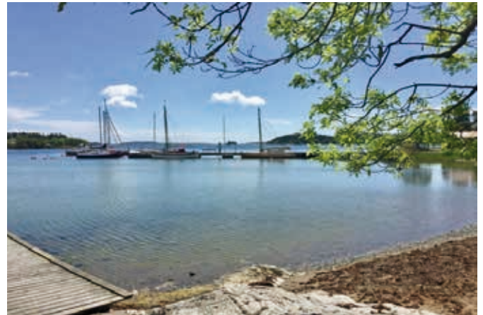
Nere i hamnen ligger några båtar och väntar på sina ägare för att komma ut och känna på vindarna.

TORSDAG - denna dag väntade nog många på, en båttur till Tullgarns slott med en guidad tur i huset. Väldigt intressant historik.