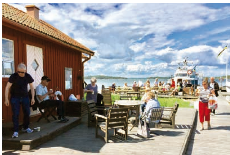
Efter rundvandring på ön blev det dax för fika innan båtturen tillbaka.