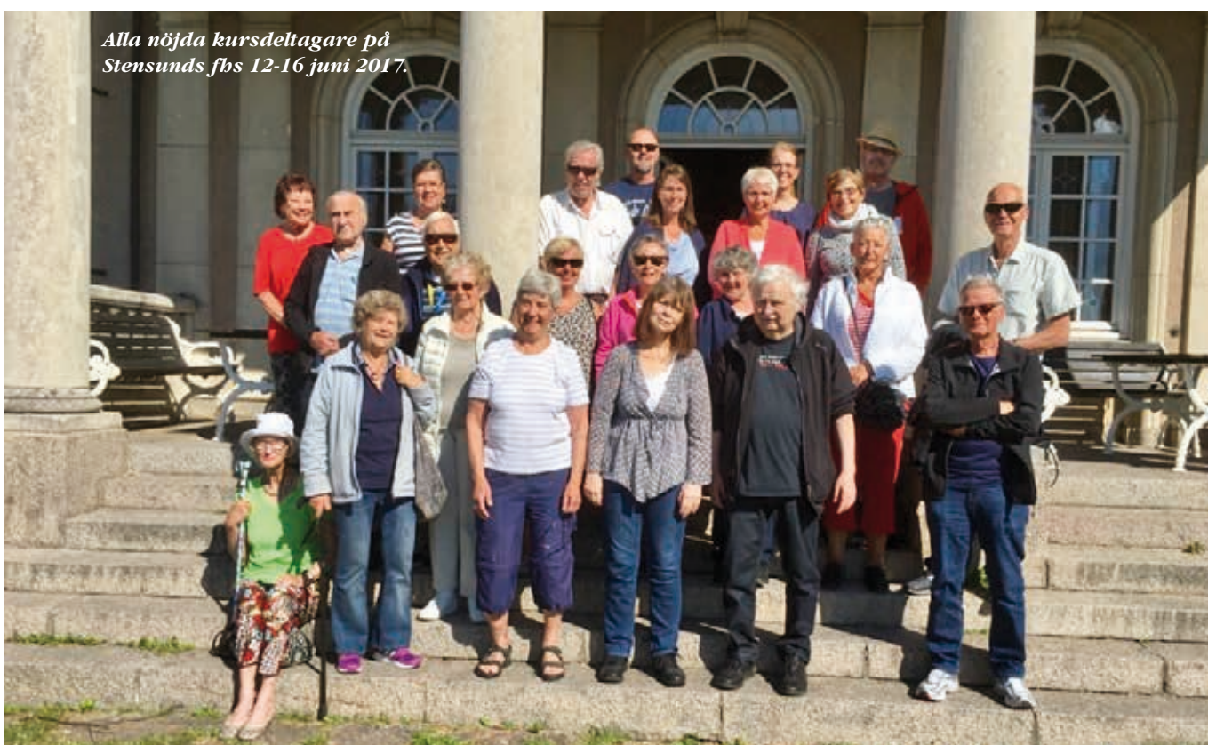
Alla nöjda kursdeltagare på Stensunds fbs 12-16 juni 2017.