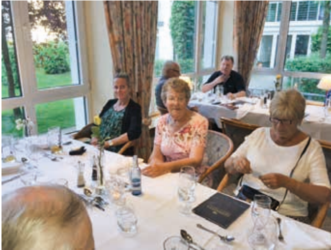
Andra kvällen avslutades med en lika smaklig middag som kvällen innan.

pagne, men får inte ha den benämningen. En visning, av hur sekttillverkningen går till, ingick också.