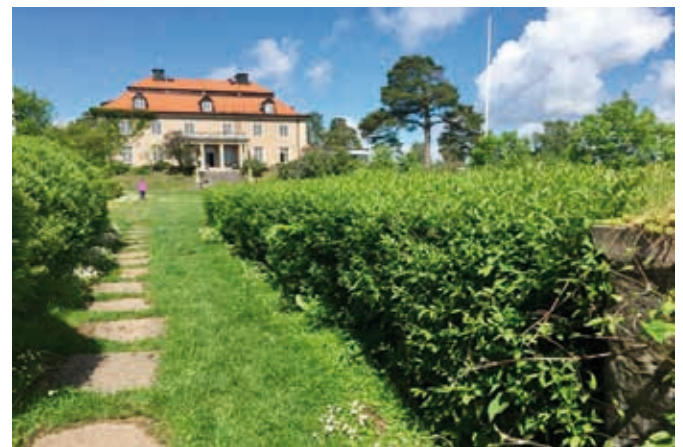
Stensunds fhs sedd från trappan som leder ner till hamnen.

Efter Tullgarn åkte vi med skepparen till Kromö, under resan dit hade vi lunch.