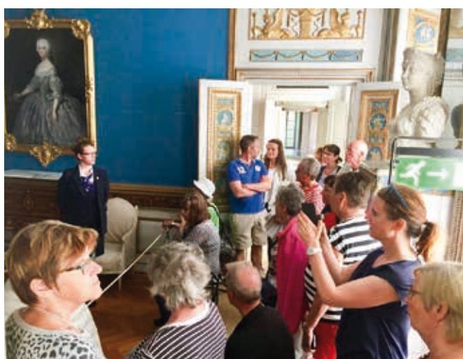
Intressant guidning för oss.