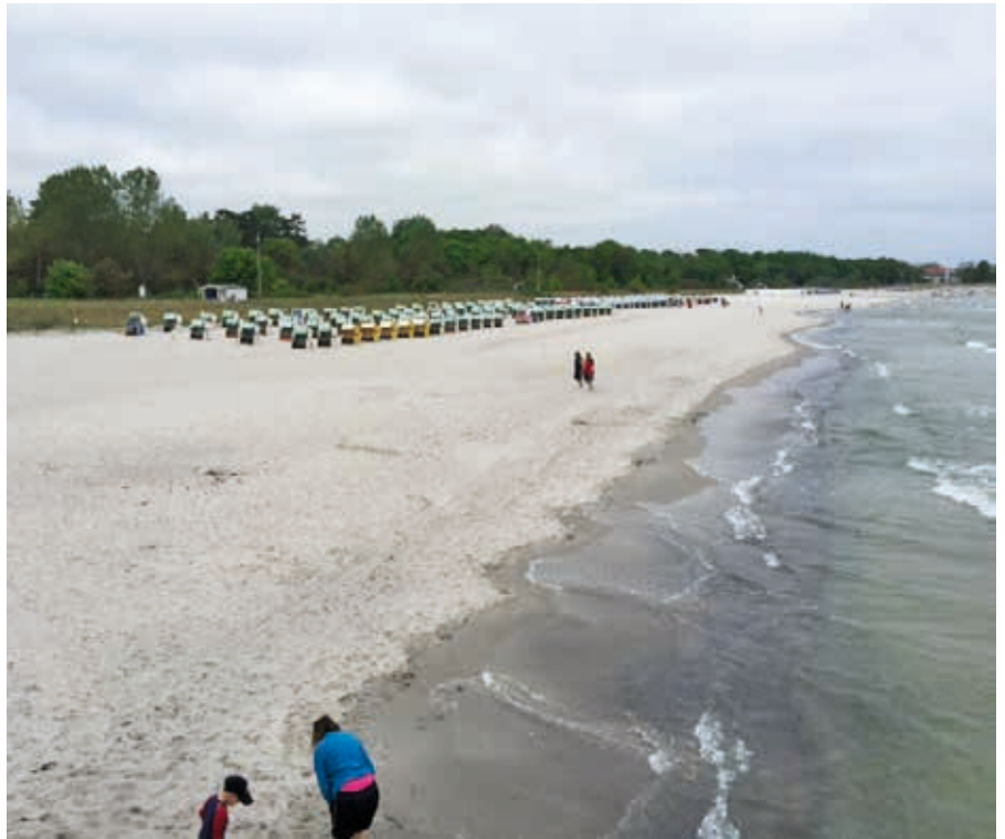
Det kalla vattnet lockade nog inte till något dopp för någon i vår grupp.

Efter tågturen blev det lite egen tid i hansastaden Wismar med sin medeltida stadskärna. Så blev det besök hos Hanse Sektkelleri. Där provsmakade vi fyra olika sorters sekt. Sekt kan jämföras med cham-