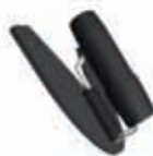
HandsFree™ Speech Aid Holder