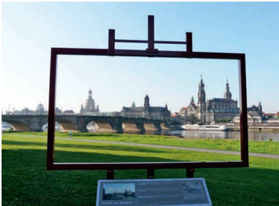
Den vackra vyn över den på nytt uppbyggda "gamla stan" i Dresden med floden Elbe i förgrunden.

Tecumseh Fitch inledde med en föreläsning om evolutionen av den