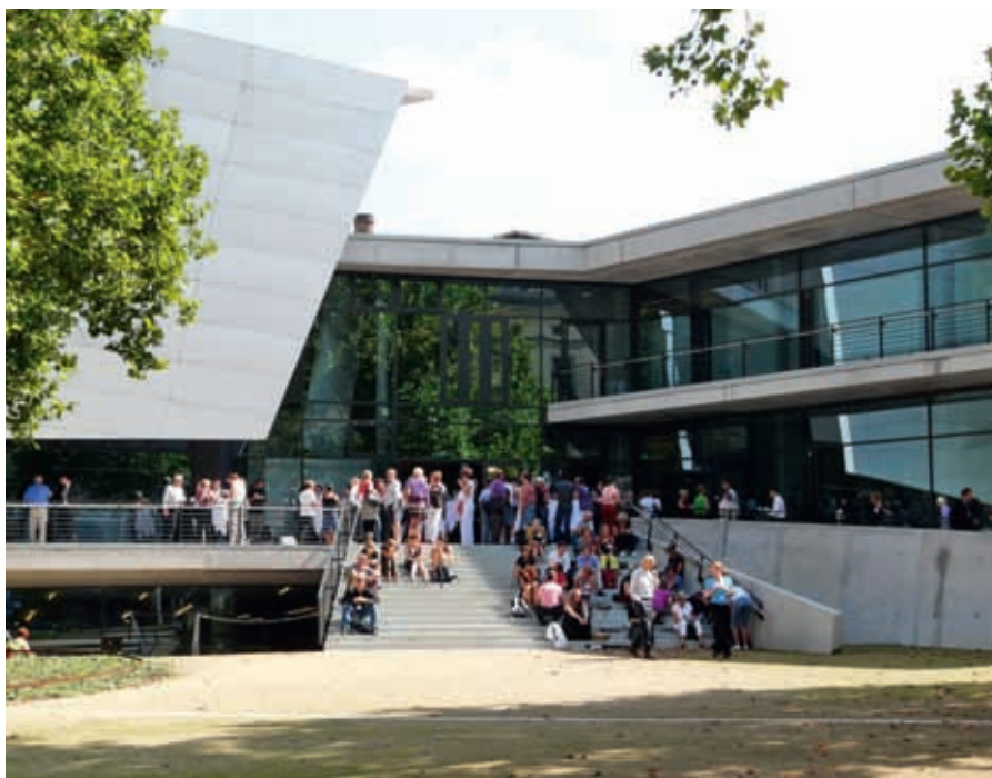
Hochschule für Musik Carl Maria von Weber, Dresden med Pevoc8 deltagare.

lalåt har upptäckts. Fåglar använder syrinx, således området där luftstrupen delar sig vid bronkerna, och kan på detta sätt bilda t o m två ljud samtidigt. Mycket avancerat! Struphuvudet har hos fåglarna ingen skyddande funktion ner till luftvägarna, som hos oss människor. Människan och många ryggradsdjur