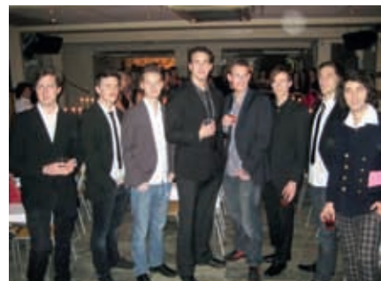
Blivande kollegor samlades för fotografering.

På sista dagen samlades ett gäng trötta men glada studenter bestående av bland annat den tidigare styrelsen för SLOSS och de tilltänkta ersättarna. Den goda brunchen gav