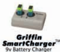
Griffin SmartCharger™ 9v Battery Charger