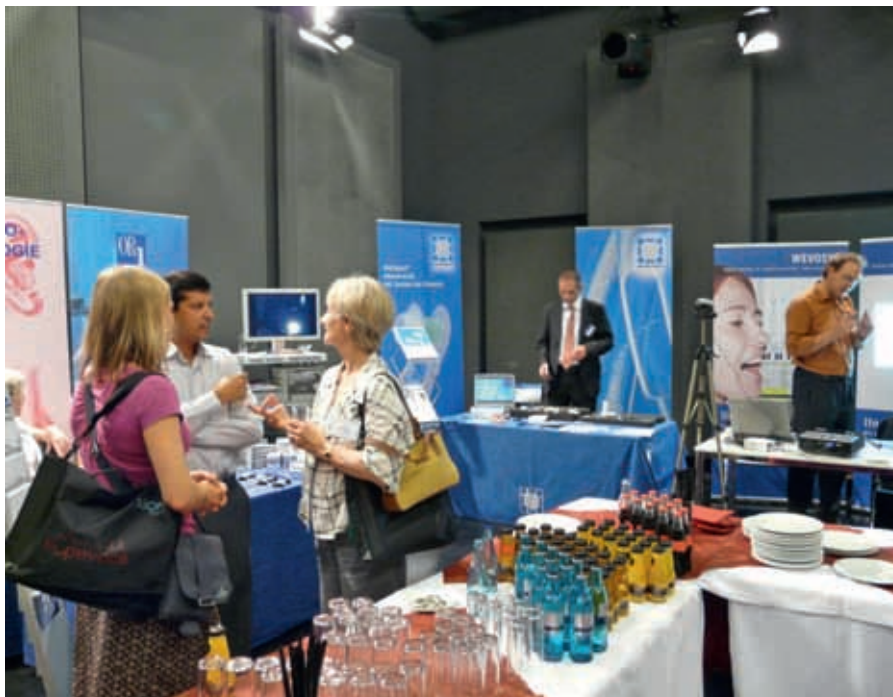
Inne på musikhögskolan: Demonstration av olika tekniska produkter för laryngectomerade.

En härlig föreläsning gavs av den brasilianska logopeden, PhD Mara Behlau, som i rasande snabbt tempo höll ett föredrag runt röstterapeutens dagliga utmaningar i sin