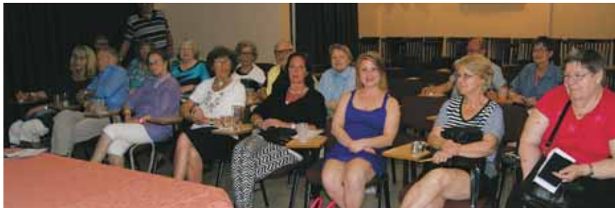
Deltagarna på resan

Resan startade på Landvetter med ett försenat flyg. Vi skulle kommit iväg kl 18.30 men kom iväg kl. 00.30 men den som väntar på något gott kan ju inte vänta för länge sägs det ju.