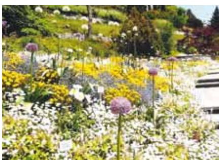
Blomsterprakt på Mainau