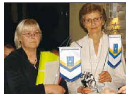
Två av Hedersmedlemmarna