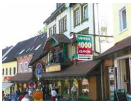
Lägg märke till det stora gökuret på busfasaden

vackra blomsterön i Bodensjön som tillhörde greve Lennart Bernadotte. Det var tidigt på säsongen. En hel del blommor hade slagit ut men man förstod vilken prakt det