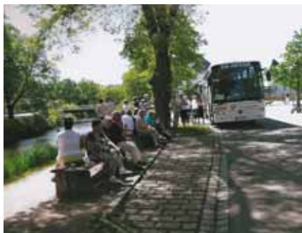
Vi tog kafferast intill en av de små floder som bildat Donau

skulle komma att bli längre fram. Vi gjorde också en rejäl rundtur i det vackra Schwarzwald, "de svarta skogarna" med höga höjder och djupa dalar. Vi åkte på "Klockvägen" – namnet av de många klockfabrikerna och urmakerierna i området – och besökte den lilla kurorten Triberg med dess stora utbud av gökur. Staden ger ett speciellt intryck med sina stora gökur på affärsfasaderna. Här