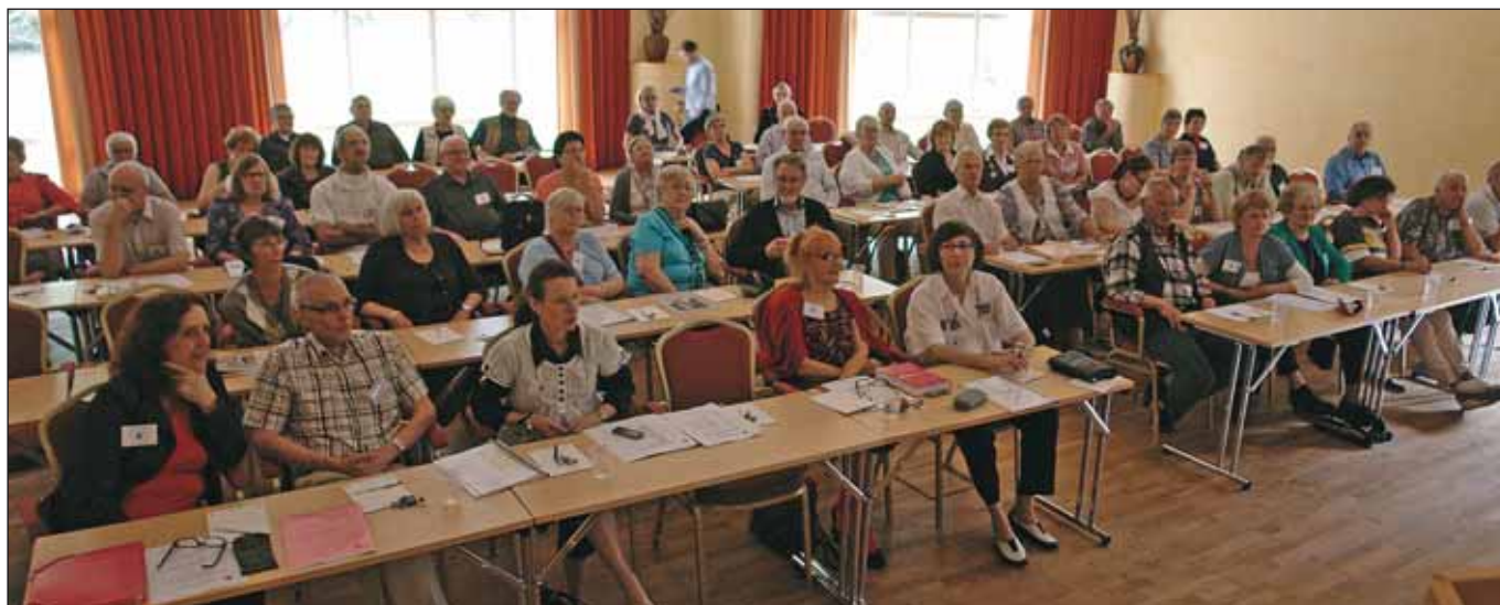
Deltagarna på Nova Park