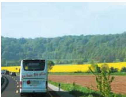
Vi åkte genom ett soligt och vårligt landskap

I DEN ARLA lördagsmorgonen hade vi två startplatser, en i Linköping och en i Norrköping. Linköpingsbussen tog E4 söderut och norrköpingsbussen E22. Under vägen fanns flera påstigningsplatser för resenärerna. Efter att ha passerat Öresundsbron sammanstrålade bussarna vid färjeläget i Rödby. Vi angjorde Tyskland i Puttgarden och åkte vi vidare mot Hannover, där vi skulle övernatta. Vår resa gick genom ett böljande landskap