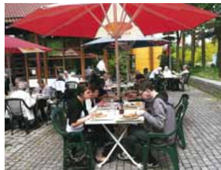
Lunch i södra Tyskland

och staden räddades. Denna avgörande händelse firas sedan dess varje år och denna gång fick vi vara med i firandet. Resan fortsatte söderut och efter en dagsetapp på omkring 65 mil var vi framme i Villingen-Schwenningen, ursprungligen två städer, som nu förenats i en med cirka 80 000 invånare.