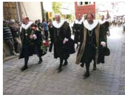
Varje år firar man att staden räddades 1631

STADEN SKULLE BRÄNNAS , men fick ett ultimatum. Om någon kunde svälja en stor bägare vin i ett enda svep skulle den räddas. Borgmästaren antog vadet, "svepte" vinet