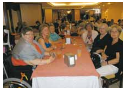
Är det matdags nu igen