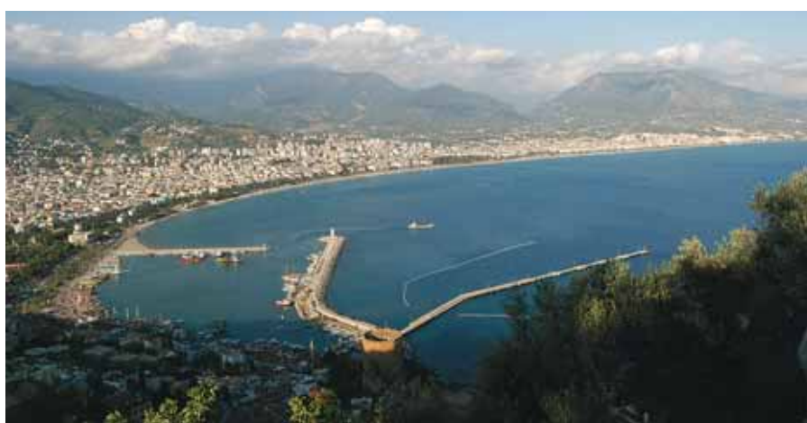
Bukten utanför staden

VI KOM TILL VÅRT HOTELL lagom till frukost, ett mycket bra hotell med god mat. Vi hade all inclusive och det var perfekt och den turkiska ölen var god.