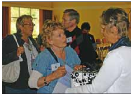
Många frågor ställdes

På grund av den rådande ekonomiska "krisen" så minskade Fondens värdepapper men man