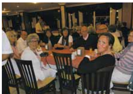
Ett glatt gäng