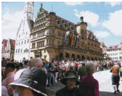
Rådhuset i Rothenburg

med en underbar vårgörnska som avbröts av de starkt gula rapsfälten, som ett väldigt lapptäcke. Första dagens resa blev lång, cirka 100 mil, och de flesta var trötta då vi kom fram till vårt hotell.