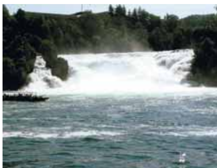
Rhen i fritt fall

skulle komma att bli längre fram. Vi gjorde också en rejäl rundtur i det vackra Schwarzwald, "de svarta skogarna" med höga höjder och djupa dalar. Vi åkte på "Klockvägen" – namnet av de många klockfabrikerna och urmakerierna i området – och besökte den lilla kurorten Triberg med dess stora utbud av gökur. Staden ger ett speciellt intryck med sina stora gökur på affärsfasaderna. Här