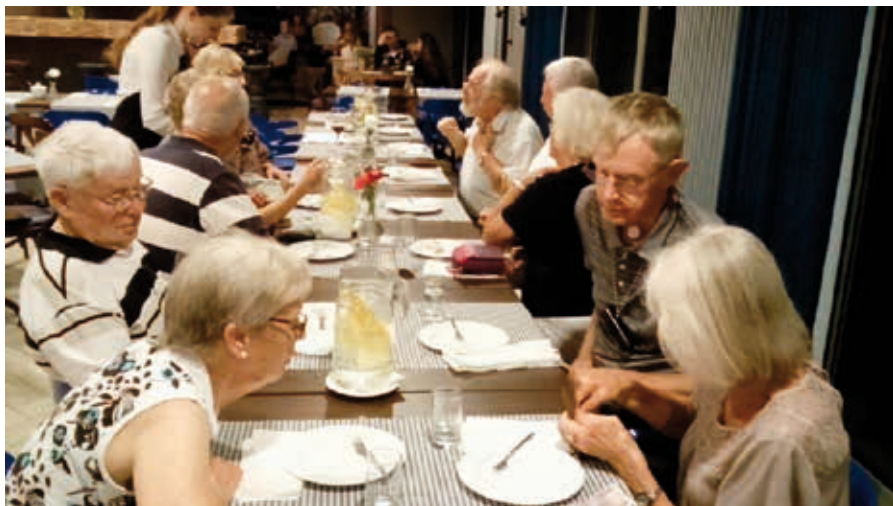
Efter att intagit våra hytter samlades vi till gemensam middag och därefter var det fria aktiviteter.

Efter frukost den 31 augusti gjordes en utflykt till Malbork, riddarborg, störst i Europa och upptagen på UNESCOs världsarvslista. Gigantiska tegelbyggnader. Fyra timmar var avsatta för denna rundvandring, intressant men mycket gående. Därefter gick bussen till ett shoppingcentra, där allehanda varor införskaffades.