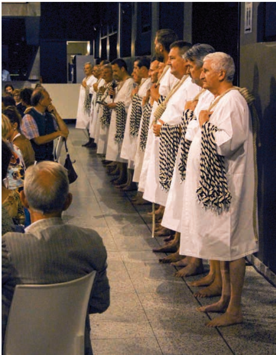
Stropdrager (snarbärare), Gent.

EN TYPISK SYMBOL för Gent är snaran, som står som symbol för det uppror som innevånarna 1539 bjöd Karl V vid revolten mot denne. Snaran gjorde att upprorsmakarna förlorade både rösten och livet.