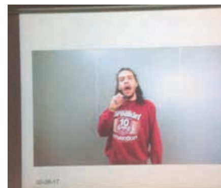
Beatboxing med röstgenerator.