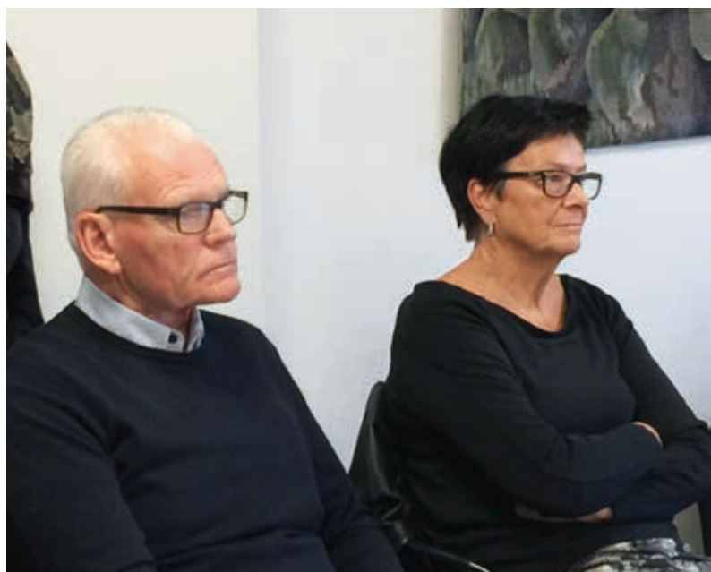
Ytterligare två intresserade medlemmar.