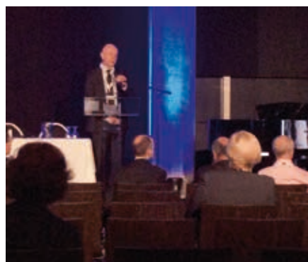
Stellan Hertegård föreläser om stamceller.

FÖRELÄSNINGEN "Röstförändring efter strålbehandling av tidigt upptäckt larynxcancer" , visade