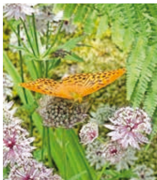
Stjärnflocka och silverstreckad pärlmorfjäril.

ETT BRA MILJÖVAL Vi värnar om miljön i kommunens mest våra kunder.