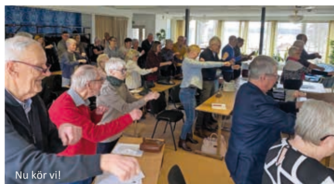
Nu kör vi!