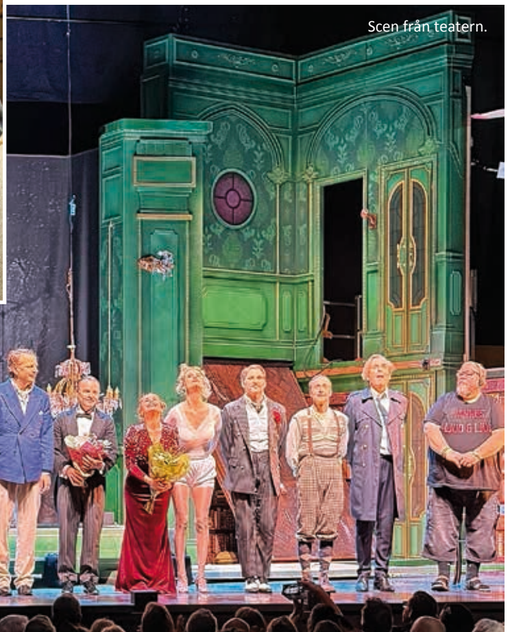
Scen från teatern.