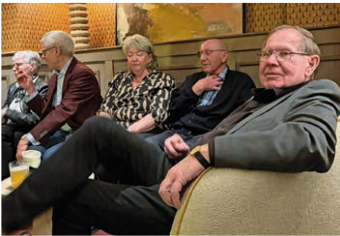
Samvaro efter teatern.