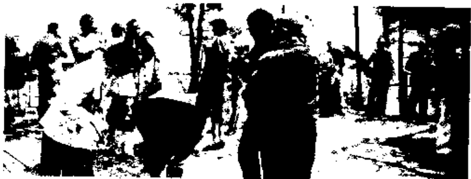
Utløst i de vakre omgivningarna. Rast för öl och mackor.

Bare fremtiden vil vise om denne hjemmebesøkestjenesten har noe for seg.