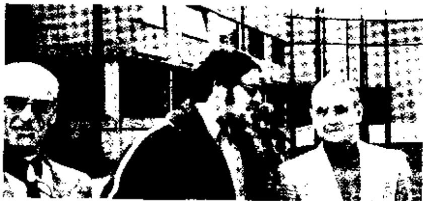
Nordisk förbrödning framför kulturcentret Birke Lassen - Herdin